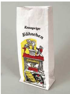
Art.-Nr. 1768 Hähnchenbeutel alukaschiert, 3-lagig, 1/1, "Max & Moritz"-Motiv Kartoninhalt 10x100 Stück