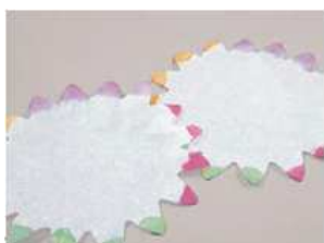
Blumenpapiere, Kartoninhalt 500 Stück*