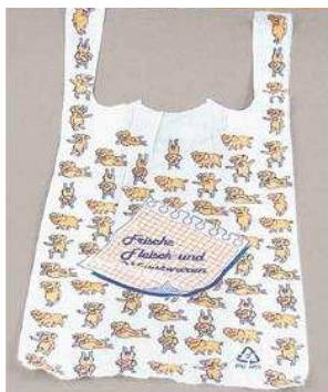
Art.-Nr. 2709 Hemdchentragetasche, HDPE-Folie, 11 my, Motiv "Schweinchen", 25x12x46 cm, Kartoninhalt 20x100 Stück