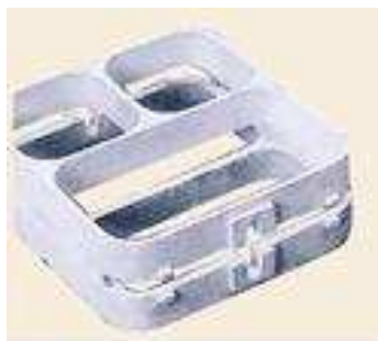
Wendesiegelrahmen*, für 2-teilige Menüschilder (auch für 3-teilige Menüschilder erhältlich)