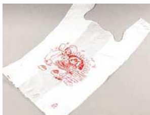
Art.-Nr. 2715 Hemdchentragetasche mit Aufdruck "Pizzabäcker", 36+24x59 cm, Weiß, Kartoninhalt 4x500 Stück*