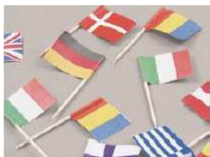
Dekofähnchen, 8cm, sortiert, Kartoninhalt 500 Stück*