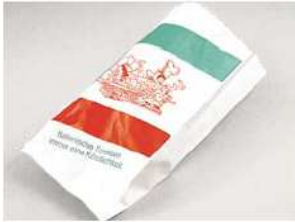
Art.-Nr. 0800 Pizzabrotchentüten, Papier gebleicht, Motiv "Pizzabäcker", 12+5x25 cm, 1.000 Stück*