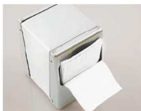
Art.-Nr. 3965 Servietten-Spender für 150 Blatt*