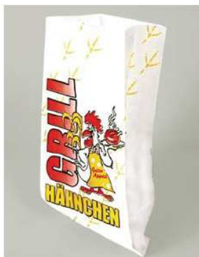
Art.-Nr. 1759 Hähnchenbeutel mit PE-Einlage, 2-lagig, 1/2, Motiv "Gockel" 10,5x5,5x25 cm, Mikrowellengeeignet, Kartoninhalt 15x100 Stück*