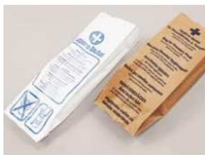
Art.-Nr. 1200 Hygienebeutel, weiß, Cellulose, 11x6x32 cm, 1.000 Stück*