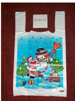
Art.-Nr. 2710 Hemdchentragetasche, weihnachtliches Druckmotiv, 17my, 30+18x55 cm, Kartoninhalt 1.000 Stück (10x100)*

**= Artikel auf Anfrage (2-3 Werkzeuge Vorlaufzeit)