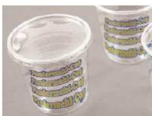
Paniermehl-Becher für 250 g Paniermehl, rund, inklusive Deckel, Kartoninhalt 500 Stück*