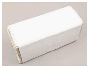
Art.-Nr. 0700 Papierhandtücher, 25x23 cm, 1-lagig, ZZ-Falz, in grau, weiß oder grün erhältlich, Kartoninhalt 20x250 Stück