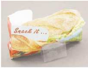
Snackverpackung mit 10 Haltern, Motiv "Snack it...", 16+5x12 cm, Kartoninhalt 1.000 Stück*