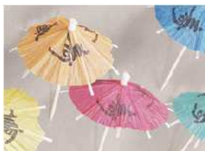
Japanschirmchen, Kartoninhalt 144 Stück*