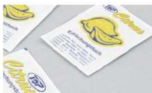
Art.-Nr. 0350 Citrus-Reinigungstücher von TOP®, 250 Stück* Kartoninhalt 4x250 Stück