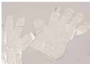
Art.-Nr. 4515 Handschuhe, PE, ungedudert, Gr. XL, 50 Stück (Kartoninhalt 200x50 Stück)*