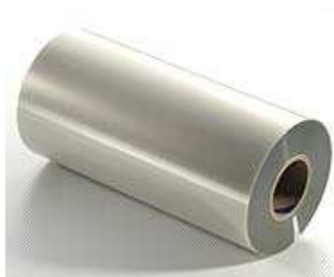
Art.-Nr. 3945 Thermo-Alufolie, unbedruckt, 30 my, 24,5 cm breit, 250 Meter-Rolle*