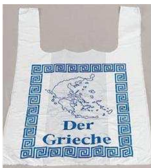
Art.-Nr. 2721 Hemdchentragetasche, Motiv "Der Grieche", 30x18x50 cm, Kartoninhalt 8x250 Stück*